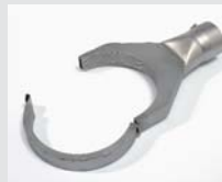
Folding reflector 125 x 22 mm Article No: 107.330