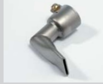
Angled nozzle 20 mm, 90° angled Article No: 105.556