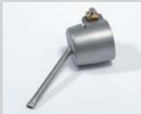
Lötdüse Ø 3 x 1.5 mm, oval Artikel-Nr.: 107.148