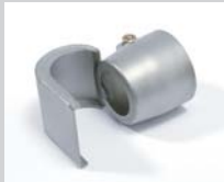
Löffelreflektor 25 x 30 mm Artikel-Nr.: 107.313