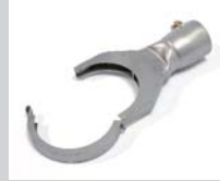
Folding reflector 70 x 12 mm Article No: 107.315