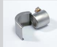
Spoon reflector 25 x 30 mm Article No: 107.312