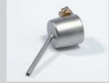
Soldering nozzle Ø 2 mm Article No: 107.146