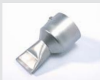
Bandschweißdüse 40 mm Artikel-Nr.: 107.134