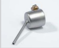
Lötdüse Ø 2 mm Artikel-Nr.: 107.146