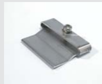
Scraper nozzle, only with heater tube, Article-No: 116.053 Article No: 116.054