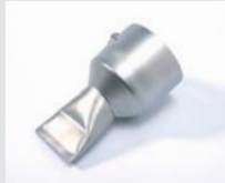
Tape welding nozzle 40 mm Article No: 107.134