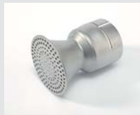
Sieve reflector Ø 65 mm Article No: 106.127