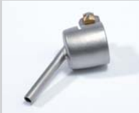
Soldering nozzle Ø 4 mm Article No: 107.151