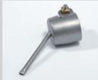
Soldering nozzle Ø 3 x 1.5 mm, oval Article No: 107.148