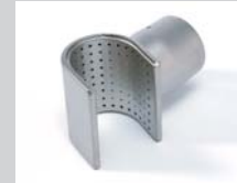
Sieve reflector 50 x 35 mm Article No: 107.308