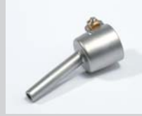
Tubular nozzle Ø 5 mm Article No: 107.144