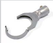
Klappreflektor 70 x 12 mm Artikel-Nr.: 107.315