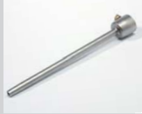
Verlängerungsdüse Ø 5 x 150 mm, gerade Artikel-Nr.: 105.567