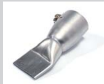
Breitschlitzdüse 40 mm Artikel-Nr.: 106.999