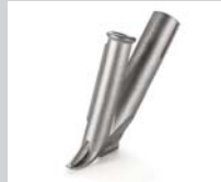
Speed welding nozzle *, with small air-slide, Ø: 3 mm 4 mm 5 mm Art. No.: 105.431 105.432 105.433