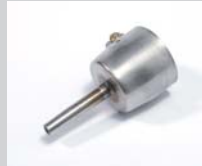
Tubular nozzle Ø 5 mm Article No: 107.154