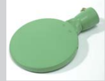
Welding mirror 135 mm, PTFE coated Article No: 107.345