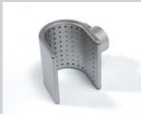
Siebreflektor 50 x 35 mm Artikel-Nr.: 107.311