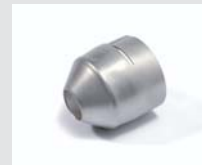
Round nozzle 20 mm Article No: 107.229