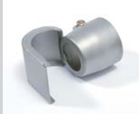
Spoon reflector 25 x 30 mm Article No: 107.313