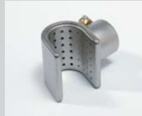
Sieve reflector 20 x 35 mm Article No: 107.310