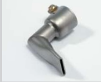
Winkeldüse 20 mm, 90° abgewinkelt Artikel-Nr.: 105.556