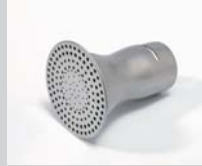
Sieve reflector Ø 65 mm Article No: 107.319