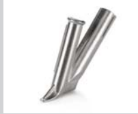
Speed welding nozzle * Ø: 3 mm 4 mm 5 mm Art. No.: 106.989 106.990 106.991