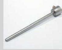
Extension nozzle Ø 5 x 150 mm, straight Article No: 105.567