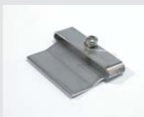
Schaberdüse, nur mit Heizelementrohr, Artikel-Nr.: 116.053 Artikel-Nr.: 116.054