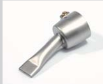
Wide slot nozzle 20 mm Article No: 106.998