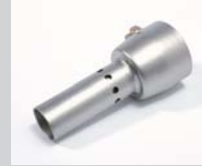
De-horning nozzle Article No: 107.007