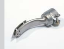
Ironing nozzle 15 x 25 mm Article No: 107.305