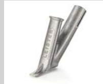
Speed welding nozzle *, triangular shaped, 5.7 mm 7 mm Article No: 106.992 106.993