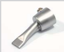
Breitschlitzdüse 20 mm Artikel-Nr.: 106.998