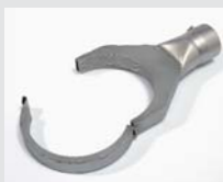
Klappreflektor 125 x 22 mm Artikel-Nr.: 107.330