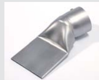
Wide slot nozzle 75 x 2 mm, delivered with stand, Article-No: 116.753 Article No: 107.266