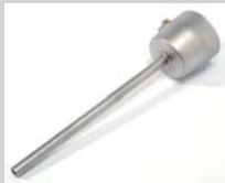
Verlängerungsdüse Ø 5 x 130 mm, gerade Artikel-Nr.: 107.006