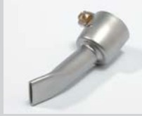
Wide slot nozzle 15 mm Article No: 107.141