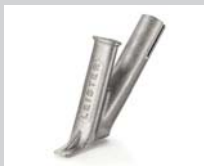
Schnellschweißdüse *, Dreiecksprofil 5.7 mm 7 mm Artikel-Nr.: 106.992 106.993