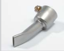
Breitschlitzdüse 15 mm Artikel-Nr.: 107.141