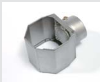
Folding reflector 60 x 75 mm Article No: 107.328