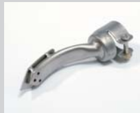
Bügeldüse 15 x 25 mm Artikel-Nr.: 107.305