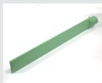
Heizschwanz 74 x 12 x 520 mm, Kanten gerundet, PTFE-beschichtet Artikel-Nr.: 107.347