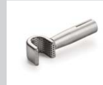
Sieve reflector (Ø 8.25 mm) *, 10 x 12 mm Article No: 107.324

* use in combination with Ø 5 mm: 107.144 105.567 107.154 107.006