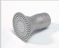
Siebreflektor Ø 65 mm Artikel-Nr.: 107.319