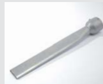
Wide slot nozzle 45 x 12 x 350 mm Article No: 105.961