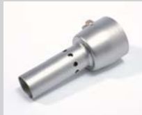
Enthorndüse Artikel-Nr.: 107.007