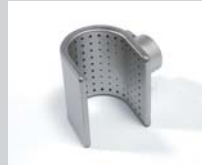
Sieve reflector 50 x 35 mm Article No: 107.311