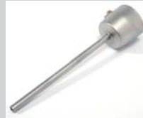
Extension nozzle Ø 5 x 130 mm, straight Article No: 107.006