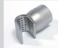
Sieve reflector 35 x 20 mm Article No: 107.309