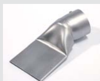
Breitschlitzdüse 75 x 2 mm, geliefert mit Standfuß, Artikel-Nr.: 116.753 Artikel-Nr.: 107.266