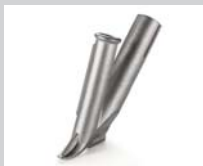
Schnellschweißdüse *, schmaler Luftschlitz, Ø: 3 mm 4 mm 5 mm Art.-Nr.: 105.431 105.432 105.433