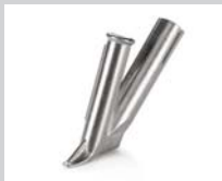
Schnellschweißdüse * Ø: 3 mm 4 mm 5 mm Art.-Nr. 106.989 106.990 106.991