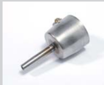
Rohrdüse Ø 5 mm Artikel-Nr.: 107.154