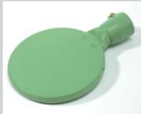
Schweisspiegel 135 mm, PTFE-beschichtet Artikel-Nr.: 107.345