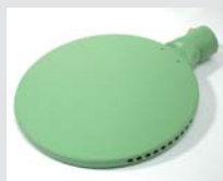
Schweisspiegel 270 mm, PTFE-beschichtet Artikel-Nr.: 107.346