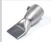
Wide slot nozzle 40 mm Article No: 106.999