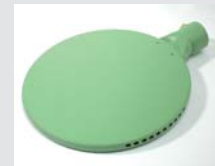
Welding mirror 270 mm, PTFE coated Article No: 107.346