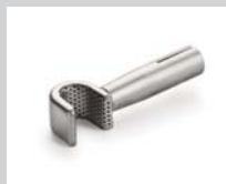
Siebreflektor (Ø 8.25 mm) *, 10 x 12 mm Artikel-Nr.: 107.324

* Aufschiebbar auf Düsen mit Ø 5 mm: 107.144 105.567 107.154 107.006