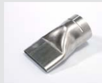
Wide slot nozzle 70 x 10 mm Article No: 107.258