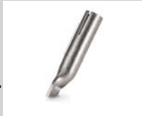
Tacking nozzle * Article No: 106.996