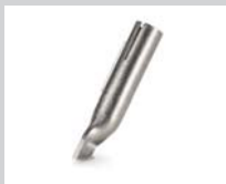
Heftdüse * Artikel-Nr.: 106.996