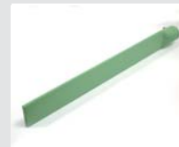
Swordshaped nozzle 74 x 12 x 520 mm, edges rounded, PTFE coated Article No: 107.347