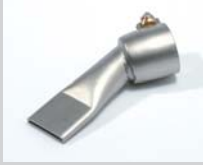
Wide slot nozzle 20 mm Article No: 107.142