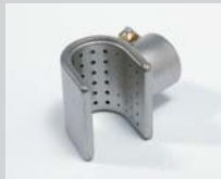
Siebreflektor 20 x 35 mm Artikel-Nr.: 107.310