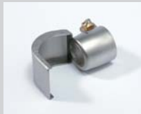
Löffelreflektor 25 x 30 mm Artikel-Nr.: 107.312