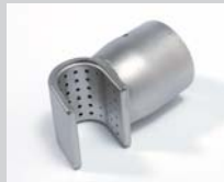
Siebreflektor 35 x 20 mm Artikel-Nr.: 107.309