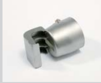
Soldering reflector 17 x 34 mm Article No: 107.325