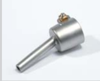
Rohrdüse Ø 5 mm Artikel-Nr.: 107.144